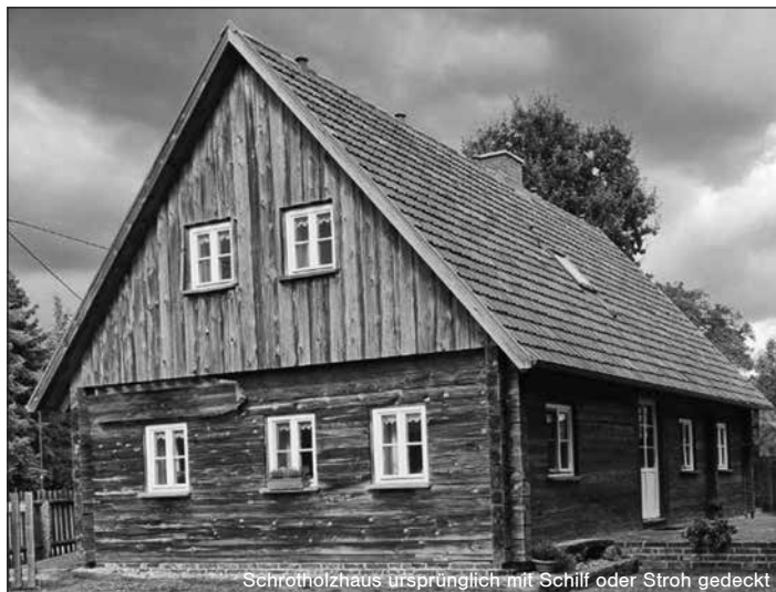
Schrottholzhaus ursprünglich mit Schilf oder Stroh gedeckt

3. Getreideaussaat für die erste Ernte im Sommer 4. Vorbereitung auf den ersten Winter, Anlegen von Brennholzvorräten. Unter solchen Bedingungen war gegenseitige Unterstützung zwingend geboten. Die Kolonisten hatten keine materielle Unterstützung, weder vom Landesherrn noch vom Lehnsadel, zu erwarten. Unter den genannten Bedingungen wird die Lebenserwartung der ersten Siedlergeneration nicht sehr hoch gewesen sein. In einem norddeutschen Denkmalsdorf las ich den Spruch: Dem ersten der Tod/dem zweiten die Not/dem dritten das Brot.