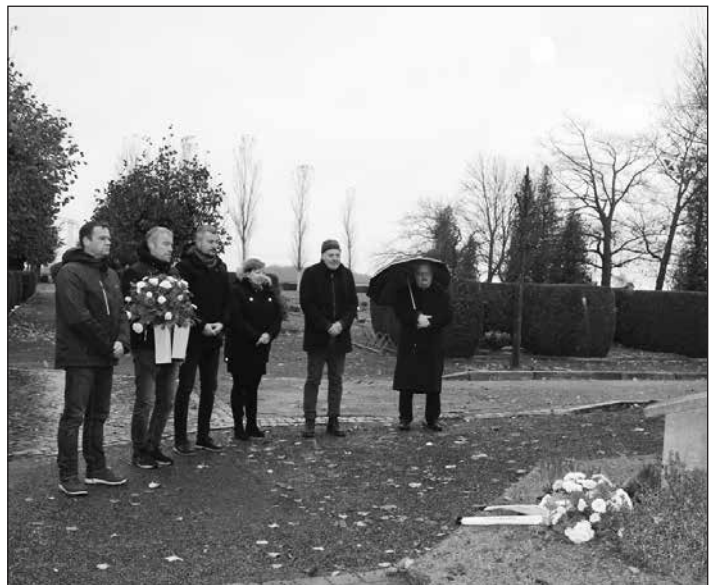
Kranzniederlegung auf dem Äußeren Friedhof in Großröhrsdorf

Zur Erinnerung und Gedenken an die Kriegstoten und Opfer der Gewaltbereitschaft und Gewaltherrschaft aller Nationen legten auch zum Volkstrauertag am 17. November Bürgermeister, Ortsvorsteher und Vertreter des Stadtrates und der Ortschaftsräte an insgesamt neun Kriegsdenkmalern in Großröhrsdorf und seinen Ortsteilen (siehe auch Artikel Seite 4) Kränze nieder. Ihre Gedanken verweilten aus diesem Anlass auch bei den aktuellen Kriegen in der Welt und deren vielen Leidtragenden, denen durch diese Gewalt grundlegende Menschenrechte verwehrt werden.