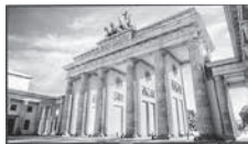
Vertrieb durch Technisat