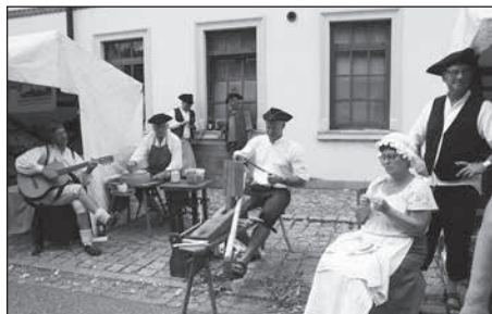
Der Traditionsverein Fischbach zeigt historisches Handwerk.