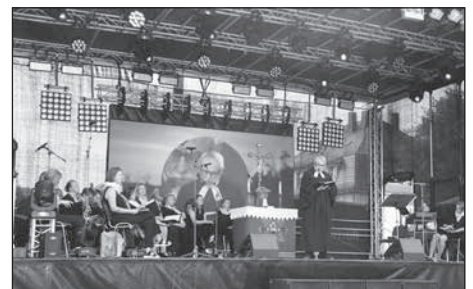
Der Sonntag beginnt mit einem Open Air Gottesdienst.