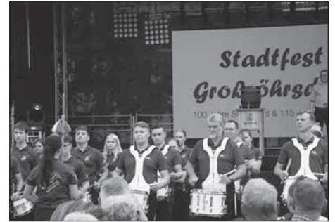
Eröffnung des Festwochenendes mit dem Spielmannszug Kleinröhrsdorf