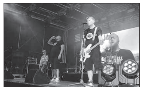
Mit Feuerwerk und Coverband Stainless Steel geht das Stadtfest lautstark zu Ende.