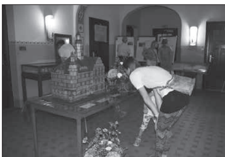
Zahlreiche Besucher genießen die Aussicht vom Rathausurm und besuchen die Ausstellungen im Rathaus.