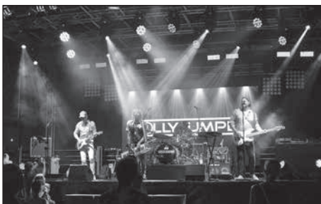
Drei Bühnen laden am Samstagabend zum Tanzen ein