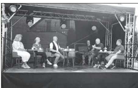
Kaffeeklatsch auf der Bühne am RöderSaal