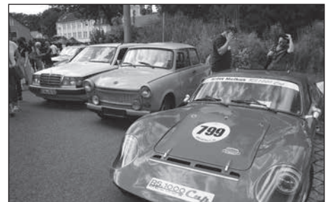
Wahre „Schätze“ werden zur Oldtimermeile organisiert durch den Gewerbeverein Rödertal und Umgebung e.V. präsentiert.