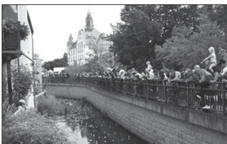
Danach findet das 20. Entenrennen entlang der Röder statt.