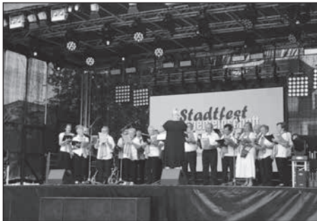
Seniorenachmittag mit der Singgemeinschaft Hauswalde und den Kirchenchören Großröhrsdorf und Kleinröhrsdorf