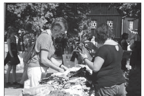
Die Kindersachenbörse sammelt 542,30 € für den Spielplatz an der Walther-Rathenau-Straße. (→ Seite 3)