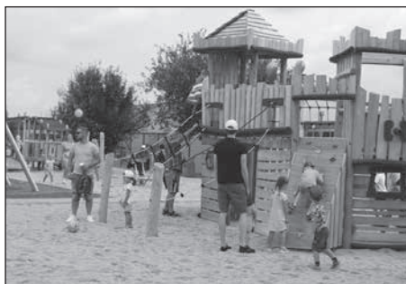
Der Spielplatz an der Walther-Rathenau-Straße wird eingeweiht.