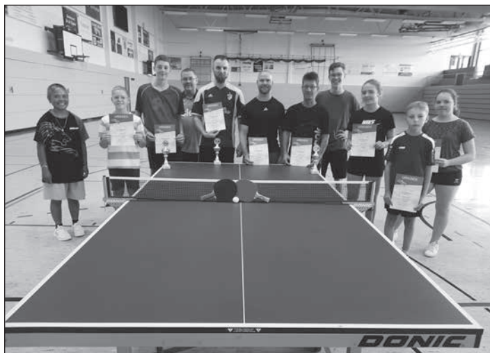
Teilnehmer am TT-Turnier zum Stadtfest 2024