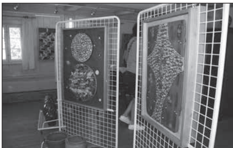
Mit einer Sonderausstellung „Neues von den Knöpfen“ feiert das Heimatmuseum sein 125jähriges Bestehen.