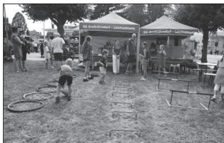
Zahlreiche Vereine, Schulen, Kitas präsentieren sich zum Stadtfest und laden zu Mitmach-Aktionen ein.