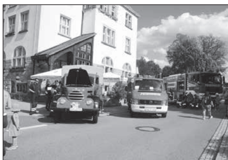
Die Blaulichtmeile bietet einen eindrucksvollen Einblick in die Technik und Fahrzeuge von u.a. Feuerwehr, Polizei und Rettungsdienst.