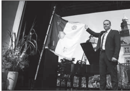
Zum 100jährigen Stadtrecht erhält die Stadt eine Jubiläumsfahne.