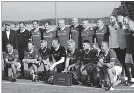
Spiel des Ost-Fußball-Traditionsteams gegen eine Auswahl des SC 1911 e.V.

Der Bürgermeister und die Organisatoren des Stadtfestes bedanken sich bei allen Beteiligten, die solch ein buntes Programm ermöglicht haben und bei den vielen Besuchern des Stadtfestes.