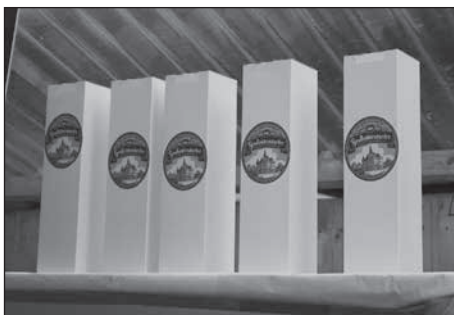
Wer von den 400 Flaschen Jubiläumsbier eine kaufen wollte, musste sich beeilen.

Der Bürgermeister und die Organisatoren des Stadtfestes bedanken sich bei allen Beteiligten, die solch ein buntes Programm ermöglicht haben und bei den vielen Besuchern des Stadtfestes.