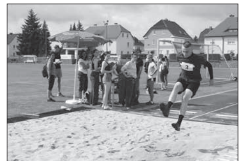
Das Sportabzeichen konnte im Stadion abgelegt werden.