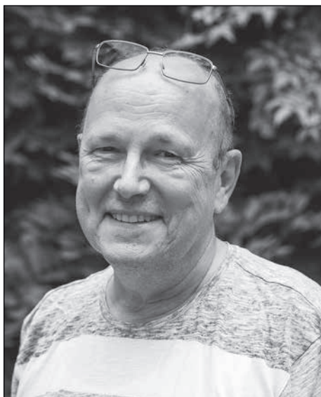
Autor Matthias Stark

Bernd Storch wird vielen noch als Detlef, der legendäre Schiffskoch auf der „Fichte“ in der