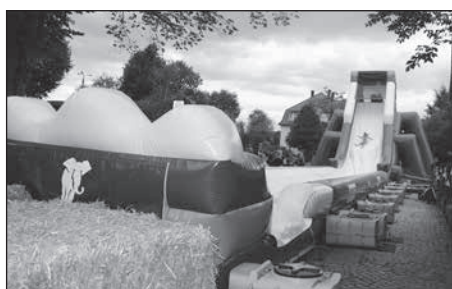
Riesenrutsch-Spaß an der GageSlide