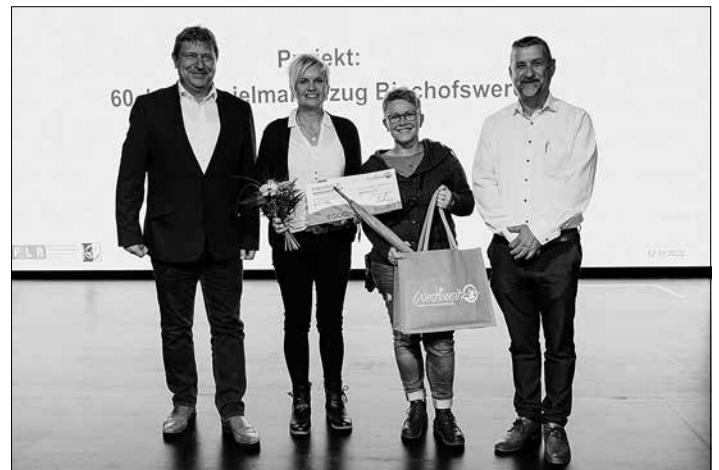
Vertreter der Bischofswerdaer Spielleute freuen sich über den ersten Platz beim Publikumsvoting