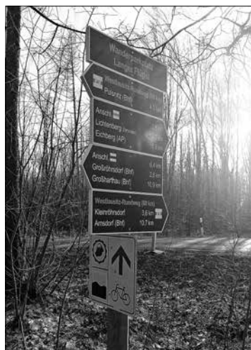
Neue Beschilderung am Wanderparkplatz „Langer Flügel“ mit dem neuen „Westlausitz-Rundweg“

Bereits seit 2019 arbeitet die Stadt Großröhrsdorf mit weiteren 11 Kommunen am Projekt „Qualifizierung Wanderwegenetz der LEADER-Region Westlausitz“. Das Wanderwegenetz soll die bereits bestehenden thematischen Radrouten der LEADER-Region Westlausitz ergänzen und damit einen wichtigen Beitrag für die Freizeitgestaltung unserer Einwohner in der Region schaffen. Über das Wanderwegenetz wollen wir den Einwohnern und Touristen die Schönheit unserer Natur näherbringen. Alle Wanderwege werden aktuell neu beschildert. Dabei wurden z.B. durch die Neuentwicklung von Wanderwegen Lücken geschlossen mit dem Ziel, ein Kernwanderwegenetz zu erhalten, welches langfristig finanziell und personell unterhalten werden kann.