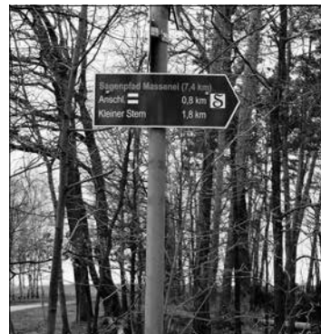
Neues Logo für den Sagenpfad

durch die Mitarbeiter des Technischen Dienstes der Stadt Großröhrsdorf mit 101 Pfosten, 175 Wegweisern und über 400 Markierungszeichen neu versehen. Auch der bereits bestehende Sagenpfad im Massenei-Wald durfte sich über ein neues Logo freuen. Die Finanzierung der Beschilderung erfolgt zu 80 % über das Regionalbudget der Region Westlausitz. Den Rest trägt jede Kommune separat. So waren in Großröhrsdorf rund 7.000 € Materialkosten für das Projekt notwendig, wovon die Stadt selbst 1.400 € plus die Arbeitsleistung des Technischen Dienstes trägt.