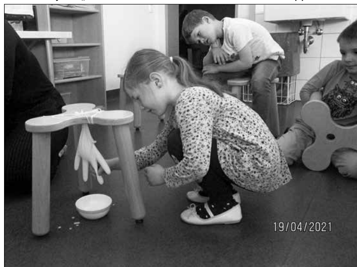
Wir probieren uns am Melken.

Milch und Milchprodukte spielen in unserem täglichen Leben eine wichtige Rolle. Sie sind ein wichtiger Beitrag für unsere Gesundheit. In unserem Projekt: „Von der Kuh zur Milch“ hat die Rote Gruppe der Kita