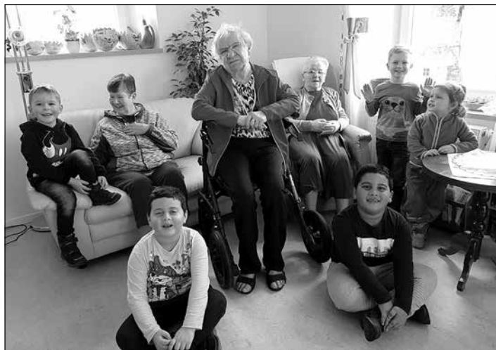
Kinder der Kita „Weberschiffchen“ zu Besuch bei den Senioren im Domizil Alte Weberei

„Blaue Weberschiffchen“, „Gelbe Weberschiffchen“ und „Grüne Mini-Weberschiffchen“ - die Gruppennamen erinnern daran, dass auf dem Gelände an der Bandweberstraße in Großröhrsdorf 200 Jahre lang Webmaschinen klapperten. Seit 1880 wurden in der Fabrik von Johann Christoph Schöne Bänder verschiedenster Art, insbesondere Verbands-