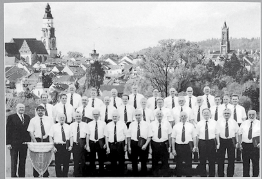
Der erfolgreiche Männerchor Kamenz-Jesau