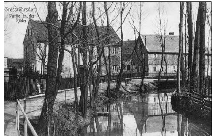
Historische Postkarte „Partie an der Röder“

stand ein Siedlungsgebiet an den Flussläufen und die Anreicherung der Bauernhöfe nannte man ein Hufedorf. Das Wort „Hufe“ ist abgeleitet vom Wort Hof und war früher ein Durchschnittsmaß des bäuerlichen Grundbesitzes. Mit der wirtschaftlichen Entwicklung wurde die Wasserkraft zunehmend zur Energiegewinnung eingesetzt. Anfangs noch zur Mehlerstellung genutzt, diente sie zum Betreiben der Maschinen der Bandwebereien. Der natürliche Flusslauf wurde nun Stück für Stück verändert. Die noch freie Flussaue mit den angrenzenden saftigen Wiesen stellen noch heute ein wertvolles Flussbiotop für Pflanzen dar. Sie bietet in feuchten Lagen auch einen idealen Lebensraum für Lurche und Insekten Lebensraum. Weil die meisten Flussaunen aber zurückgedrängt wurden, sollten die restlichen aber geschützt werden, wie es im Umweltschutzgesetz festgeschrieben ist.