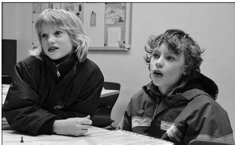
Unsere jungen Gäste