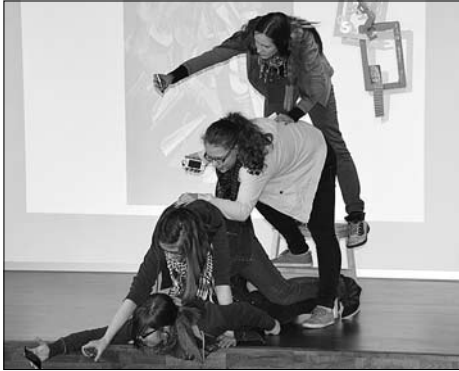
Öffentliche Probe des künstlerischen Profils Klasse 9