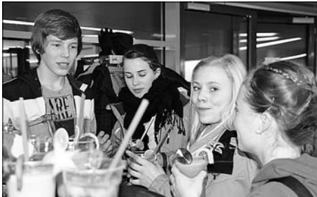
Zwischenstopp an der Saftcocktailbar