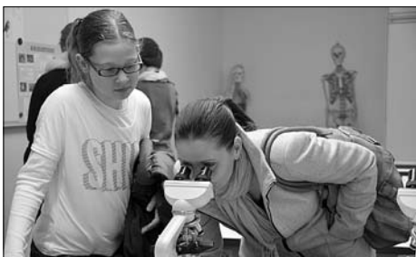
Perspektivwechsel- Spinnenbein unter dem Mikroskop