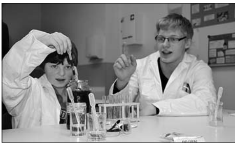
Schüler des GK 12 weckten Neugier auf den Chemieunterricht.