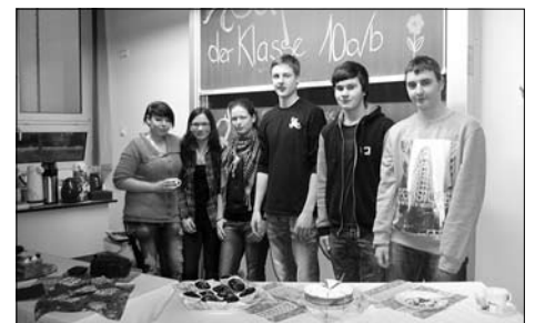
Ein breites Angebot an Imbiss und Gebäck hilft der Klassenkasse immer.