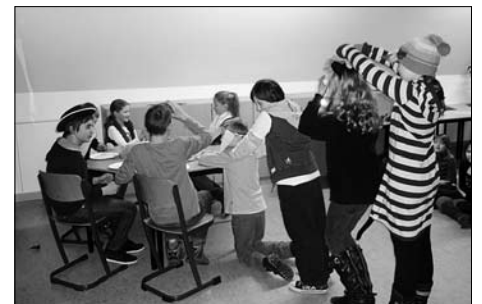
Beliebt bei der Elternschaft sind immer wieder kleine Theaterstücke und Rezitationen. Hier treffen gerade die Bremer Stadtmusikanten ein.