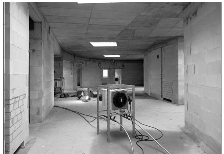
Bauheizung ermöglicht das Arbeiten auch während des Winters im Gebäude

Ebenso sollen nach Fertigstellung der Installationen und Einbau der Türzargen die Innenputzarbeiten starten. Die Bohrungen zur Erdwärme für die geothermische Anlage erfolgen voraussichtlich Anfang Februar. Die im Ortsteil Kleinröhrsdorf entstehende Kindertagesstätte mit 26 Kinderkrippenplätzen und 56 Kindergartenplätzen ist eines der größten Bauvorhaben in der Stadt Großröhrsdorf. Mit dem Kita-Neubau reagiert die Stadt auf den gesetzlichen Anspruch ab August 2013 auf einen Betreuungsplatz für Kinder vom ersten bis zum dritten Lebensjahr. Ab August 2013 sollen die Kommunen Plätze für 35 Prozent der unter Dreijährigen vorhalten. Der Neubau löst zugleich die alte Kita „Waldhäuschen“ in Kleinröhrsdorf ab und schafft über 36 neue Plätze.