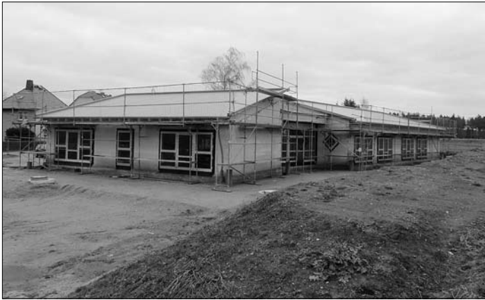
Aussenansicht mit Haupteingang

Die Bauarbeiten an der neuen Kindertagesstätte liegen im Plan. Bereits vor dem Wintereinbruch im vergangenen Jahr konnte der Rohbau durch Dachkonstruktion sowie eingebaute Fenster und Türen winterfest gemacht werden.