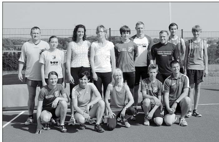
Jugend- und Erwachsenengruppe

Zahlreich nahmen Sportler aus Pulsnitz und Großröhrsdorf, neben den Startern aus Bischofswerda und Kamenz teil. Eine Beteiligung der 6 eingeladenen Schulen, über die vereinsgebundenen Schüler hinaus, hätten wir uns gewünscht, blieb aber aus.