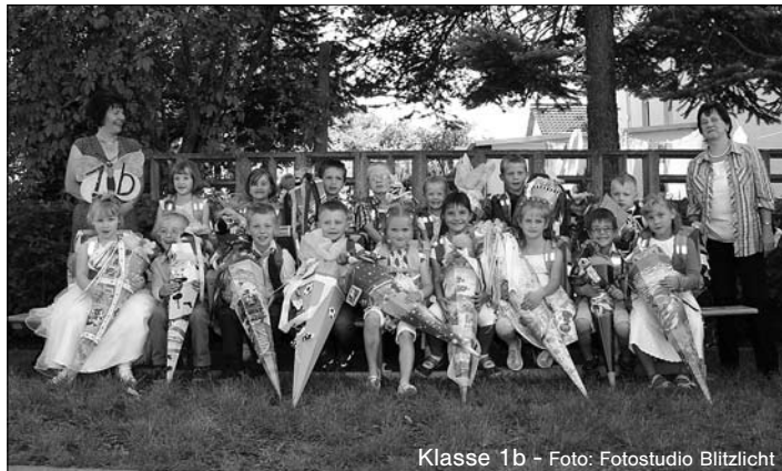
Klasse 1b

Nun führte ein Umzug alle Schulanfänger mit ihren Klassenleitern und Horterziehern, begleitet von Eltern und Gästen endlich an die Zuckertütenbäume, in der Hoffnung, dass die Tüten noch nicht geerntet wurden. Als die Erstklässler an der Schule ankamen, war die Freude groß. Bei blauem Himmel und Sonnenschein leuchteten riesengroße bunte Zuckertüten an den Bäumen auf dem Schulhof und warteten nur noch darauf, abgenommen zu werden.