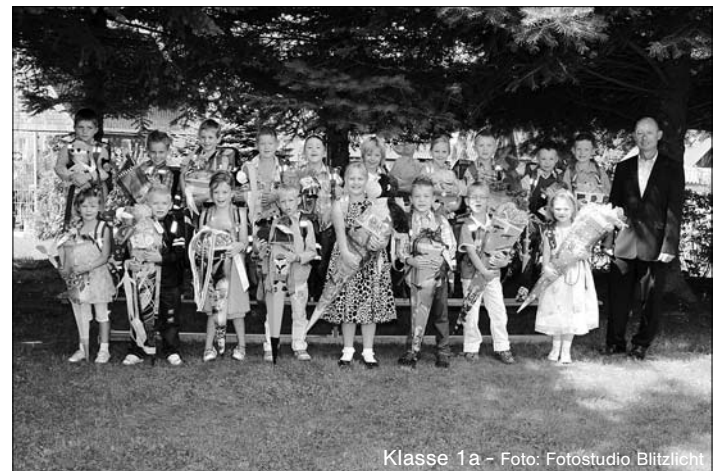
Klasse 1a - Foto: Fotostudio Blitzlicht

Am Sonnabend, den 20.08.2011, wurden wieder drei 1. Klassen in die Grundschule Großröhrsdorf eingeschult.