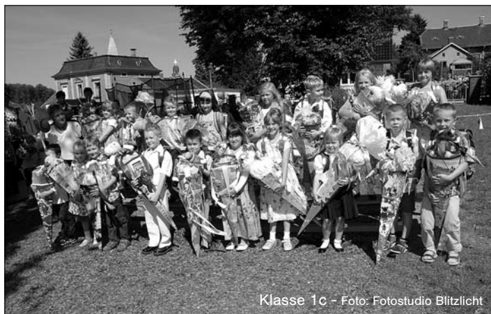
Klasse 1c - Foto: Fotostudio Blitzlicht

Viele fleißige Helfer ermöglichten den reibungslosen und gelungenen Ablauf des Schuleinganges in Großröhrsdorf.