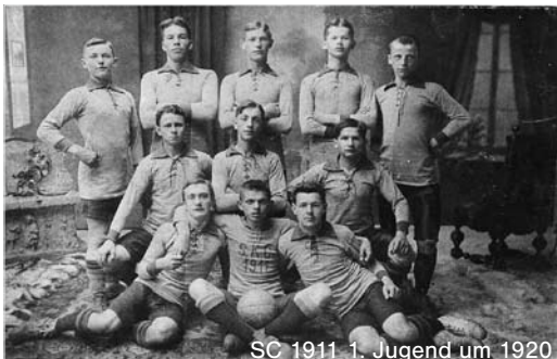
SC 1911 1. Jugend um 1920