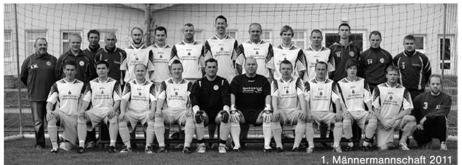
1. Männermannschaft 2011

„Wo ein Kopf ist, ist meistens auch ein Brett“