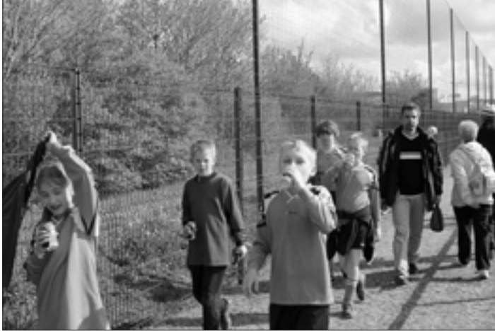
Nach dem Spiel

Nach einem letzten Abendessen im Astrolabe ging es pünktlich um 21.00 Uhr wieder Richtung Heimat. Diese erreichten wir am Dienstag um 19.00 Uhr und alle wurden herzlich in Empfang genommen. Bleibt nur noch zu sagen, die Reise war wieder sehr schön und wir freuen uns schon auf Oktober, wenn unsere Freunde aus Le Relecq-Kerhuon wieder bei uns in Bretnig-Hauswalde zu Gast sein werden.