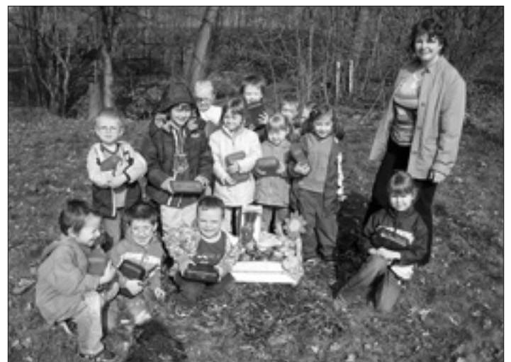
Eine Gruppe der AWO-Kita mit der Osterüberraschung

Der 07. April 2009 war ein besonderer Tag in der Lidl-Filiale Großröhrsdorf. Neben dem normalen Kassiergeräusch tönnten aus den Nebenräumen der Filiale fröhliche Kinderstimmen und freudiges Lachen. An diesem Tag hatte das Team des Einkaufsmarktes zwei Gruppen der AWO-Kindertagesstätte „Regenbogenland“ zum Osterbasteln eingeladen. Mit Hilfe der Erzieherinnen wurde fleißig ausgeschnitten, gemalt und geklebt. Die Ergebnisse dieser Arbeit konnten sich sehen lassen – wunderschöne Osterhaseneierbecher, wobei keiner dem anderen glich.