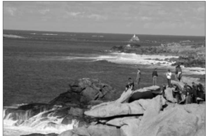
Ausflug an das Meer

Am Samstag trafen wir uns 9.30 Uhr am Kermaria, um von dort aus mit Dudelsackmusik und bunten Fahnen einen Umzug durch Le Relecq-Kerhuon zu veranstalten. Nach diesem Umzug waren alle bei ihren Gasteltern zum Mittagessen eingeladen. Um 14.30 Uhr ging es mit dem Bus an die nördliche Atlantikküste der Bretagne. Dort besuchten wir einen der größten Menhire, der eine Höhe von 10 Metern aufweisen kann. Im Anschluss ging es ca. 3,5 km zu Fuß entlang der Steilküste.