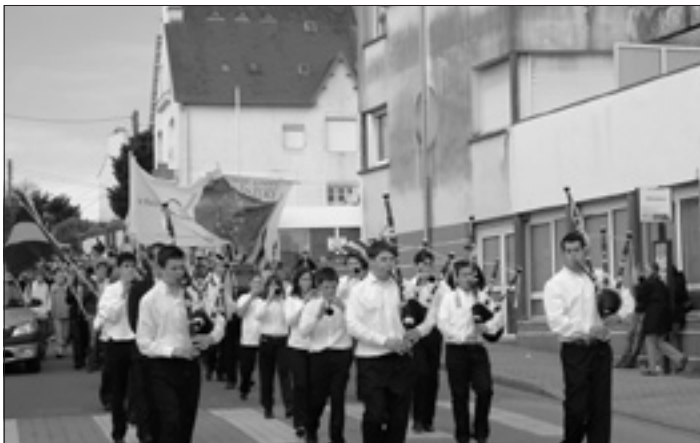
Umzug mit bretonischer Musik

Am Freitag hieß es um 9.00 Uhr treffen. Wir fuhren mit dem Bus nach Brest zum FSGT, einem Verein, der Kindern, die es sich finanziell nicht leisten können in einem Verein zu trainieren, durch Fördermittel auf na-