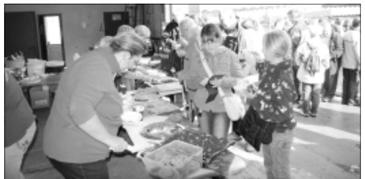
Neben Apfelkuchen gab es auch noch andere leckere Backwaren.

Auch der Heimatverein Großröhrsdorf konnte wieder mit einigen historischen Informationen aufwarten. Vielen war nicht bekannt, dass man in Großröhrsdorf Braunkohle gefunden hat und was der Rodelberg früher einmal war. Die Texte können Sie im Heimatmuseum erwerben.