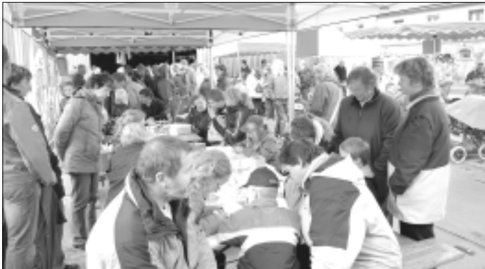
Trotz Regens herrschte großes Interesse

Die Sorgenfalten wollten am Sonntagmorgen bei diesem Gewitter mit sintflutartigem Regen nicht kleiner werden. Waren alle Bemühungen umsonst? Hat der Wettergott uns nach drei herrlich sonnigen Familienfesten verlassen? Hat er nicht.