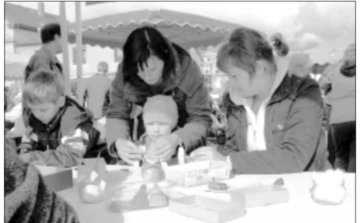
Basteln von Apfelmännchen

das Interesse an einer solchen Beratung, Obstbestimmung und Zucht, unheimlich groß ist.