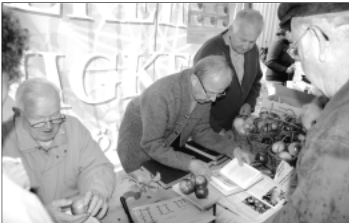
Lange Wartezeiten bei der Äpfelbstimmung