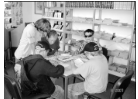
Rätselstation am 01. Juni 2007