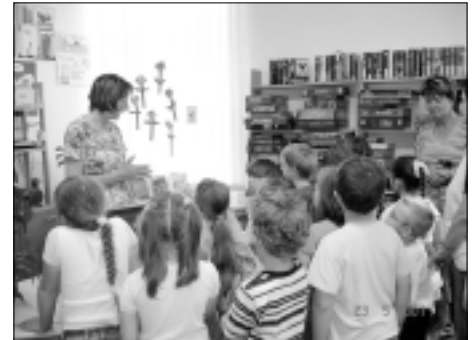
Vorschulkinder lernen Grob- / Bretnig-Hauswalde Sagen kennen