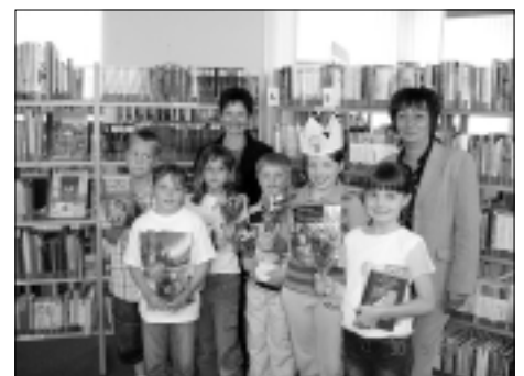
Die Leseköniginnen und -könige vom Rödertal gemeinsam mit ihren Schirmherrinnen