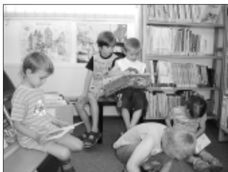
Nicht nur für VorschülerInnen - eine spannende Bücherwelt entdecken!

Am 30.09.2008 um 19.00 Uhr wird der Leipziger Autor Uwe Bauer eine „medizinische Lesung“ durchführen. Sie dürfen sich auf einen humorvollen Abend freuen.