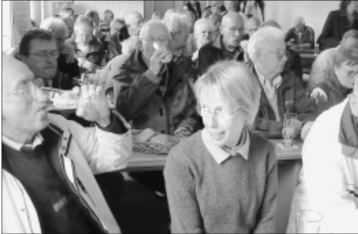
Bierverkostung in der Radeberger Exportbierbrauerei

Unsere hiesige Heimat vermittelten wir mit Büfett und Mittagstisch in der Luchsenburg und der Buschmühle. Kirchenführungen in Pulsnitz (Baustil der Kirche sowie Ziegenbalg- und Rietschel-Kapelle) und Bretznig mit Orgelspiel rundeten diese Tage mit Pkw-Fahrgemeinschaften ab. Die drei Führungen in der Radeberger Exportbierbrauerei mit