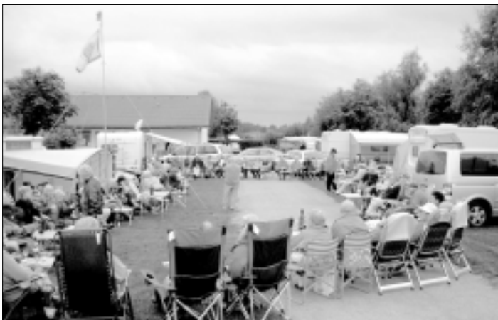
Happy Hour bei Räucherkäse und Rotwein

Der einheimische, derzeit in Sachsen einzige 5-Sterne Camping- & Freizeitpark LuxOase in Kleinröhrsdorf ist in Camperkreisen inzwischen kein Geheimtipp mehr. Touristisch optimal gelegen an der Talsperre Wallroda, sind die Attraktionen unserer Heimat, Dresden, die Oberlausitz, das Elbtal um Meißen bis zur Sächsischen Schweiz gut erreichbar. Obwohl er in allen nationalen Camping- und Caravaningführern verzeichnet ist, brachte wohl die Mundpropaganda europaweit für „Kleinröhrsdorf“ positiven Bekanntheitsgrad. Und das nicht zuletzt durch die günstig erreichbaren Einkaufsmöglichkeiten in Radeberg und Großröhrsdorf.