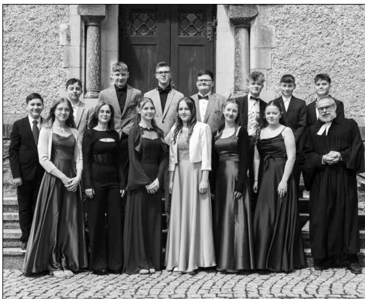
Am Sonntag, den 21. April 2024 wurden in der Kirche zu Bretinig vierzehn Jugendliche aus der Kirchgemeinde Großröhrsdorf-Kleinröhrsdorf konfirmiert.

Das Interesse am Konfirmandenunterricht und an der Konfirmation in der Evangelisch-Lutherischen Kirche wächst langsam wieder. Viele fragen: Was bedeutet die Konfirmation? Und was hat man davon? - Mit der Konfirmation (Das Wort kommt aus der lateinischen Sprache und bedeutet „Befestigung“ oder Stärkung) bestätigen die Jugendlichen nach etwa 1 ½ Jahren Konfirmandenunterricht im Alter von 14 Jahren ihre Taufe und sagen damit „Ja“ zum christlichen Glauben. Jeder wird dann einzeln an den Altar gerufen, bekommt einen Konfirmationsspruch und wird eingeseget. Jugendliche, die sich konfirmieren lassen, erhalten damit das Recht, am Abendmahl teilzunehmen, das Patenamts bei der Taufe eines Kindes zu übernehmen, sich später kirchlich trauen zu lassen und an kirchlichen Wahlen teilzunehmen.