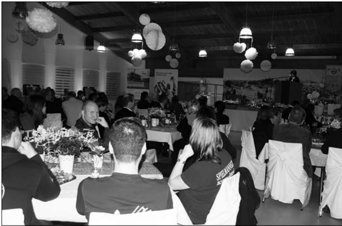
Festlich geschmückte Mehrzweckhalle

Auch in diesem Jahr luden der Gewerbeverein Rödertal und Umgebung e.V. und die Stadtverwaltung Großröhrsdorf zum traditionellen Neujahrsempfang ein. Ca. 80 Unternehmer, Bürger, Vereinsmitglieder, Stadt- und Ortschaftsräte sowie Mitarbeiter der Stadtverwaltung waren der Einladung in die eigens für diesen Anlass festlich geschmückte Mehrzweckhalle am Rödertalstadion gefolgt.