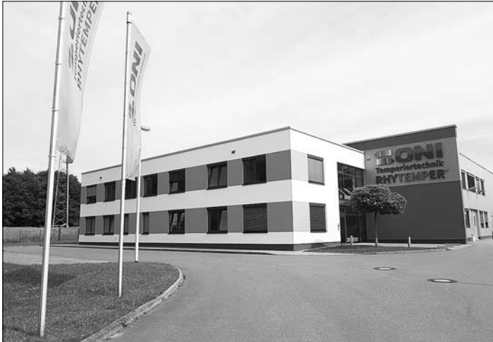
Der neue Firmensitz an der Christian-Bürkert-Straße

So lud die Firma ONI Temperiertechnik Rhytemper GmbH am 25. August zur Einweihungsfeier an den neuen Standort in Großröhrsdorf ein. Mit dem Kauf und den Umbauten hat das Unternehmen über eine Million Euro investiert. Die Fassade wurde saniert und neu gestrichen. Auch innen musste renoviert und das Gebäude den Bedürfnissen angepasst werden. Das Unternehmen verfügt nun auch über deutlich größere Sanitäranlagen und Umkleieräume und über Besprechungsräume für Schulungen, ein Gebäude mit Dämmung und Sonnenschutz vor den Fenstern. Außen wurde der Parkplatz erweitert und ein Pausenplatz für die Mitarbeiter angelegt.