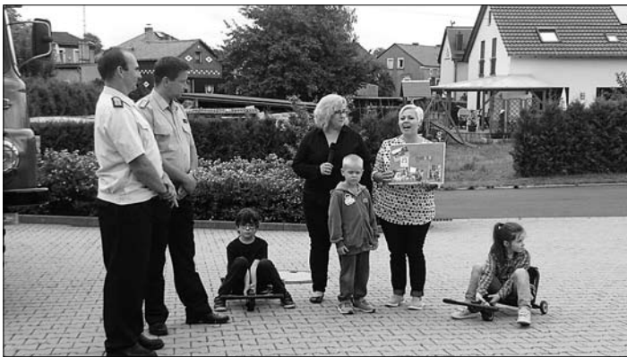
Übergabe Dankeschön der Kita Agnesheim an die Feuerwehr

Wir möchten uns an dieser Stelle recht herzlich beim Gasthof „Zum Stern“ bedanken, welcher uns schnell und unkompliziert bei einem kleinen Versorgungsproblem aushalf.