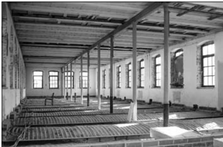
Vereinsräume in der Kulturfabrik | 2009

Auf Postern und mit einer Diashow werden realisierte Maßnahmen im Sanierungsgebiet „Stadtkern“ vorgestellt. Das Sanierungsgebiet ist durch die Industriegeschichte der Stadt geprägt und war Anfang der 1990er Jahre durch brachgefallene Industriebauten gekennzeichnet. Neben Abriss, Neuordnung und Neubebauung von Flächen dominiert vor allem die Kulturfabrik städtebaulich und stadthistorisch den Ortskern und ist ein gelungenes Beispiel für die Umnutzung einer Industriebrache.