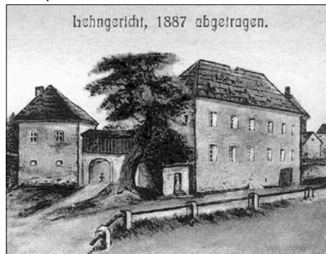
Lehngericht, 1887 abgetragen.

Erläuterung der aktuellen Baumaßnahmen Am Lehngut sowie dessen Geschichte und Zukunftspläne