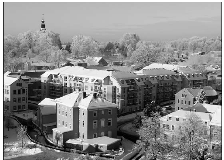
Blick vom Rathaus in Richtung pro seniore

Nach Schnee und Eis folgt das Tauwetter. Auch hier sollten die Hausbesitzer darauf achten, dass die Schleusen frei sind bzw. diese vorsorglich freihacken, so dass Wasser ungehindert abfließen kann.