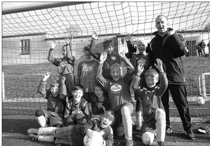
Die E-Jugend des FSV