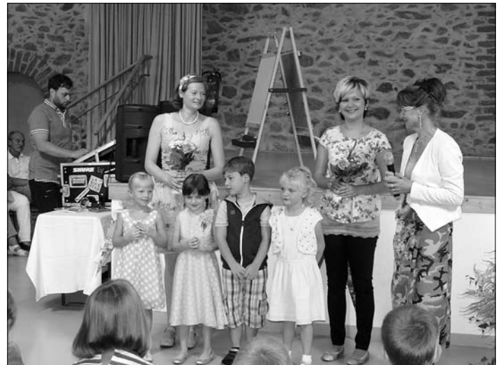
Verabschiedung der Erzieherinnen