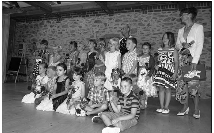
Die ABC-Schützen aus Bretnig-Hauswalde