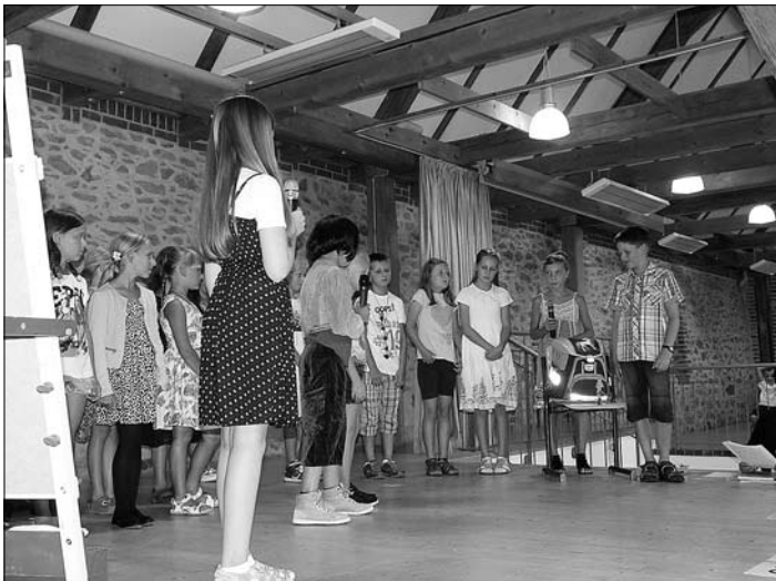
Programm der Schüler