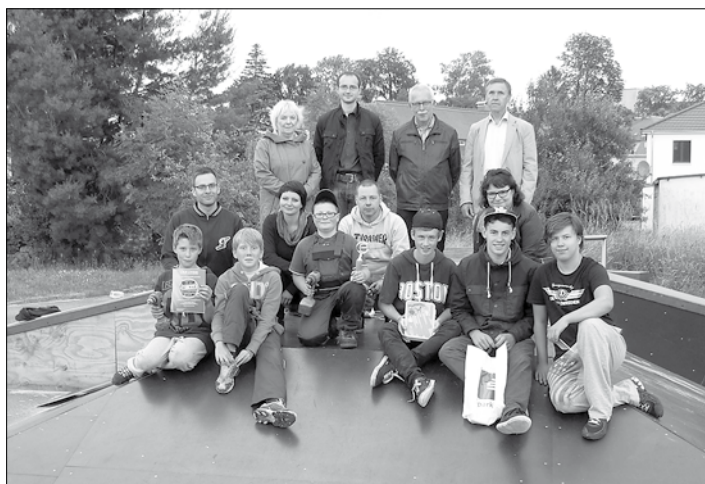
Die AG Freizeit stellte ihre Skatanlage fertig.

Die Skatebahn an der Südstraße/Ecke Schäferestraße gibt es in Großröhrsdorf zwar schon seit längerer Zeit, allerdings bisher ohne ein Element zum drüberfahren, springen und üben von Tricks. Nach vielen intensiven Bautagen ist es nun fast geschafft – nur noch einige Auflagen des TÜVs müssen eingearbeitet werden und dann ist die Skate-Pyramide endlich fertig.