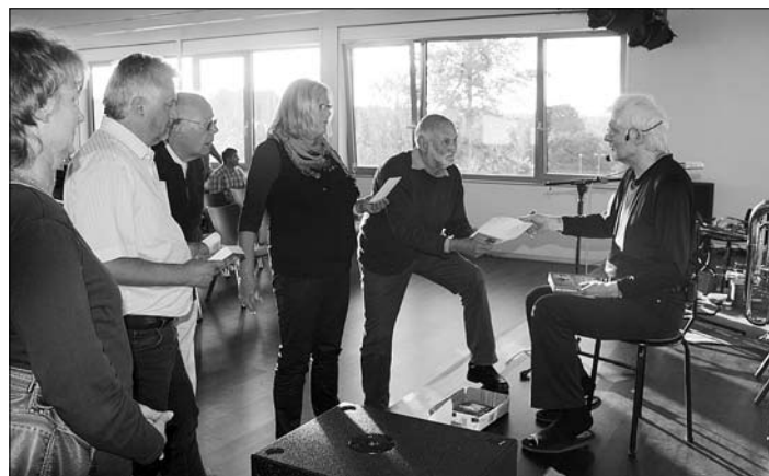
Autogrammstunde mit Ingo Insterburg

Das Multitalent Ingo Insterburg war am 7. Juni zu Gast beim KulturTreff Rödertal in der Aula des Ferdinand-Sauerbruch-Gymnasiums und überzeugte mit seinem Können alle Zuhörer. Ingo Insterburg, eigentlich Ingo Wetzker, zeigte sein ganzes Talent als Komiker, Sänger, Multiinstrumentalist, Schriftsteller und Schauspieler. In seinem aktuellen Programm „Ich liebte ein Mädchen“ verwendete er mehr als 20 selbstgebaute Instrumente, um die von ihm erdachte Raucher- und Trinker-Lyrik den Besuchern näher zu bringen. Anhand von bekannten Volksliedern demonstrierte er zunächst den Klang seiner selbstgebauten Geige, bestehend aus einer Pralinenschachtel oder der WC-Brillenharfe. Danach perfektionierte er die Darbietung mit eigens erdachten Liedern zur Thematik Rauchen und Trinken und legte damit mit ganz viel Humor den Zuhörern die Nachteile dieser Laster dar. Ebenso las er an diesem Abend Liebesgeschichten und Gedichte aus seinem Buch vor. Der 1934 geborene Künstler brachte das Publikum immer wieder und unerwartet zum Lachen, was es ihm auch mit reichlich Beifall dankte. Seine Fähigkeit, die vielen skurrilen Instrumente virtuos zu spielen, erzeugt noch immer Gefühle von Erstaunen, Hochachtung und Begeisterung beim Publikum.