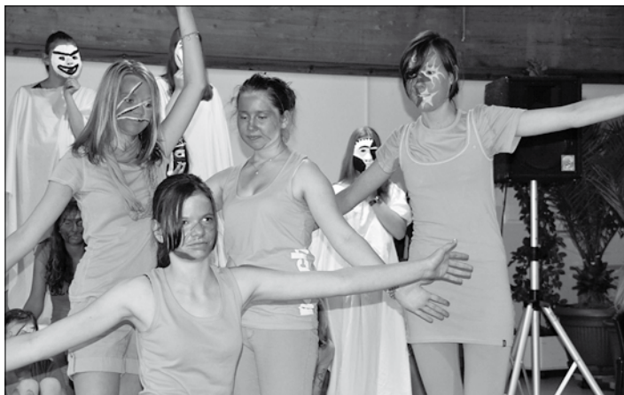
Orange - Profilkünstler

Als ein weiteres Highlight des Abends erwiesen sich die Schülerinnen und Schüler des Künstlerischen Profils der Klasse 8, die mit einer Mischung aus Bewegung, Kunst und Musik das Thema Farbe in besonderer Weise zum Ausdruck brachten.