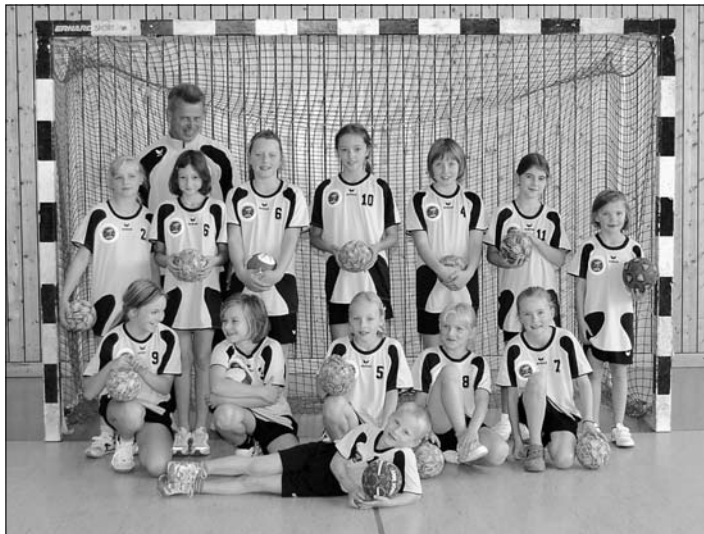
Mannschaftsfoto der „Minibienen“

sind. Bedanken möchten wir uns auch bei Tina Linge, die unsere ersten Versuche fotografisch festgehalten hat.