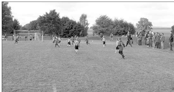
Dynamo Dresden – FSV I

Der Pokal ging am Ende wieder mit in die Landeshauptstadt. Das einzige