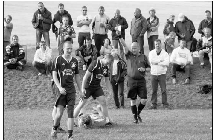
Trotz gelber Karte ein faires Turnier

Um das Turnier noch spannender zu machen, wurde in Gruppen mit Halbfinale und Finalspiel gespielt. Deshalb wurden zwei weitere Mannschaften gesucht und gefunden; das Komakommando und die Alten Herren von Bretinig.