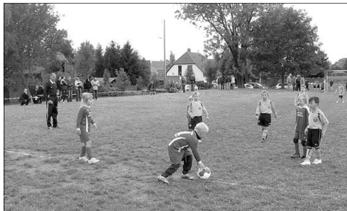
FSV II gegen die Dynamos

Aber auch alle Platzierten bekamen am Ende eine Medaille überreicht. Überglücklich und mit strahlenden Augen nahmen die Mannschaften und ihre Trainer den verdienten Lohn entgegen.