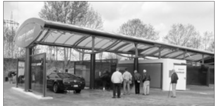
Viele Interessierte informierten sich am Tag der Eröffnung über die Funktionsweise der neuen Autowaschanlage.

Pünktlich zum bundesweiten Autowaschtage am 8. Mai feierte die neue Autowaschanlage „Power Wash Rödertal“ ihre Eröffnung. Viele Interessierte nutzen an diesem Tag die Möglichkeit, ihren PKW unter fachkundiger Hilfe auf Hochglanz zu bringen oder sich über Vorteile dieser neuen Anlage zu informieren.