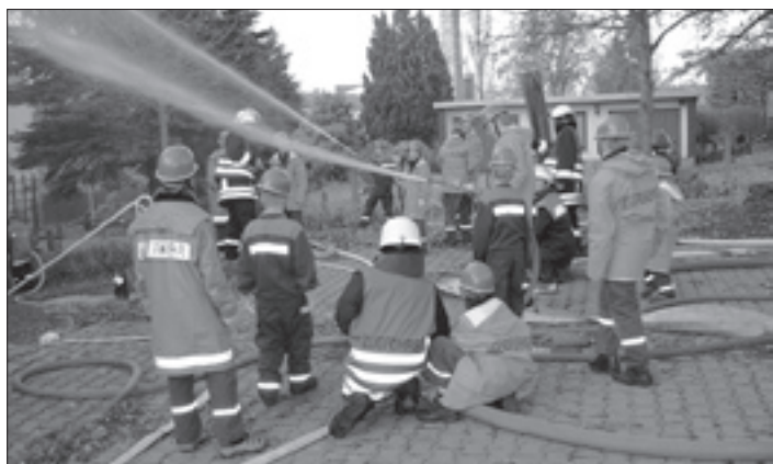
Brandbekämpfung bei einem Wohnhausbrand

Am 7. Oktober 2009 war es wieder einmal soweit. 23 Kinder und Jugendliche der Jugendfeuerwehren Großröhrsdorf und Kleinröhrsdorf trafen sich gemeinsam mit ihren Ausbildern zum nun schon fast traditionellen Berufsfeuerwehrtag. Für 24h wurde das Gerätehaus der Feuerwehr Großröhrsdorf kurzerhand zu einer Feuerwache umfunktioniert. Ziel des Tages war es, den Jugendfeuerwehrleuten den Alltag einer Berufsfeuerwehr näher zubringen und das Interesse für die Arbeit einer Feuerwehr zusteigern. Nach einer kurzen Einweisung in den Tagesablauf und nach der Einteilung der Gruppen auf die Fahrzeuge, ging es auch schon los mit der theoretischen und praktischen Ausbildung, welche sich über den gesamten Tag hinzog.