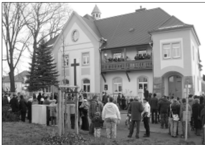
Viele Bürger nutzen die Möglichkeit, das „Agnesheim“ zu besichtigen.