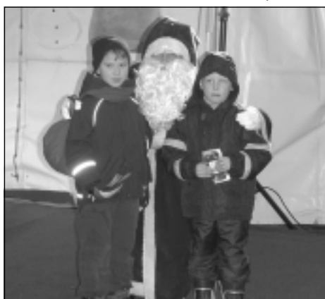
Gewinner des Kinderrätsels mit dem Nikolaus

Am Sonntag wurde der Nikolaus dann noch einmal für einen kurzen Besuch erwartet. Er hatte im Gerätehaus der FF Großröhrsdorf durch die viele Technik ganz die Zeit vergessen und musste nun mit einem Fahrzeug der Feuerwehr schnellstmöglich zum Weihnachtsmarkt gebracht werden. So konnten dann doch noch pünktlich