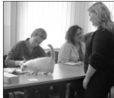
Bewertung einer Rassekatze

In diesem Jahr richtete der Verein der Bautzener Katzenfreunde „Ost-sachsen“ e.V. seine Weihnachtsausstellung in Großröhrsdorf aus.