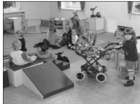
Die ersten Kinder haben sich schon eingelebt.

Denn wenn sich Erzieher mit Einfühlungsvermögen, Verständnis und Liebe ihrer Aufgabe widmen, wenn die Kinder gern kommen und eine fröhliche, sorglose, zugleich aber auch lehrreiche Zeit hier verbringen, wenn