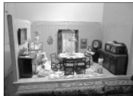
Historisches Spielzeug im Heimatmuseum