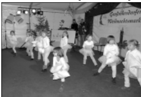
Auftritt der Kinder der Tanz- und Theaterwerkstatt Wilthen e.V.

So gab es schon am Samstagnachmittag für Groß und Klein viel Spaß mit Günthers Tierparade - einem turbulenten Programm mit vielen Tieren. Gleichfalls zeigten am Samstag die