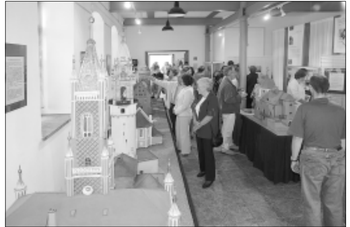
Neben imposanten Modellen erwartet die Besucher eine Fülle von historischen Informationen auf Tafeln oder in Form von Kleinausstellungsstücken

Zur Eröffnung waren bereits über 50 Gäste erschienen. Gemeinsam mit