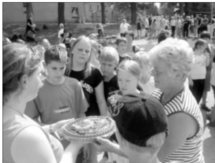
Nach den abschließenden Staffelläufen bekamen die Sieger traditionell die mit viel Liebe zur Sache hausgebackenen Kuchen überreicht.