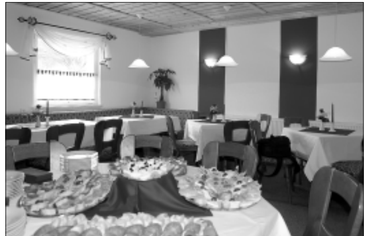
Und hier ein Blick in den renovierten Gasträum